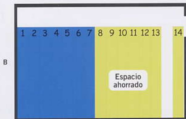
Archivo Tecny Móvil®