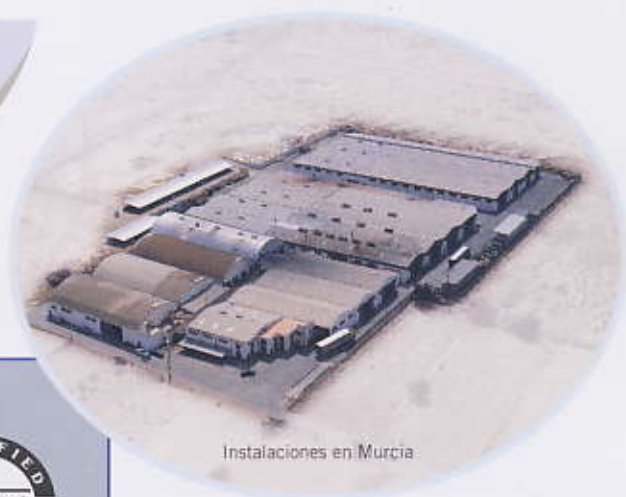
Instalaciones en Murcia