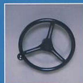
Volante para desplazar el módulo

Este tipo de archivo cuenta con una gran resistencia y solidez, combina un agradable estilo con su funcionalidad.