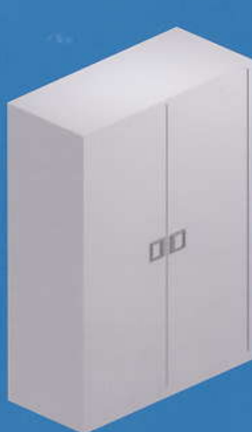
Armario de puertas abatibles

Además existen otros accesorios que completan su funcionalidad, como la opción de instalar carpeteros en los cajones.