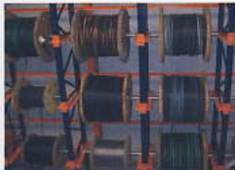
Estantería para bobinas